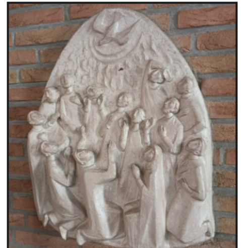
Pfingst-Darstellung im Haus St. Marien von Walter Mellmann

Zu Pfingsten geschieht ein Wunder des Verstehens: Menschen aus vielen Völkern und Sprachen hören und verstehen die Botschaft Christi. Gottes Geist macht keine Unterschiede nach Herkunft, Sprache, Stand oder Ansehen. Er erinnert uns daran: Jeder Mensch hat dieselbe Würde. Darum müssen Menschen auch gleiche Rechte haben und gleich behandelt werden. Niemand darf ausgegrenzt, abgewertet oder wie ein Mensch zweiter Klasse behandelt werden. Pfingsten ist deshalb auch ein Auftrag an uns: Wir brauchen eine Gesellschaft, die tolerant ist, solidarisch und offen für alle. Eine Gesellschaft, in der Verschiedenheit nicht Angst macht, sondern als Reichtum verstanden wird. Wo Gottes Geist wirkt, wächst Gemeinschaft. Und wo Gemeinschaft wächst, haben Ausgrenzung, Verachtung und Ungerechtigkeit keinen Platz.