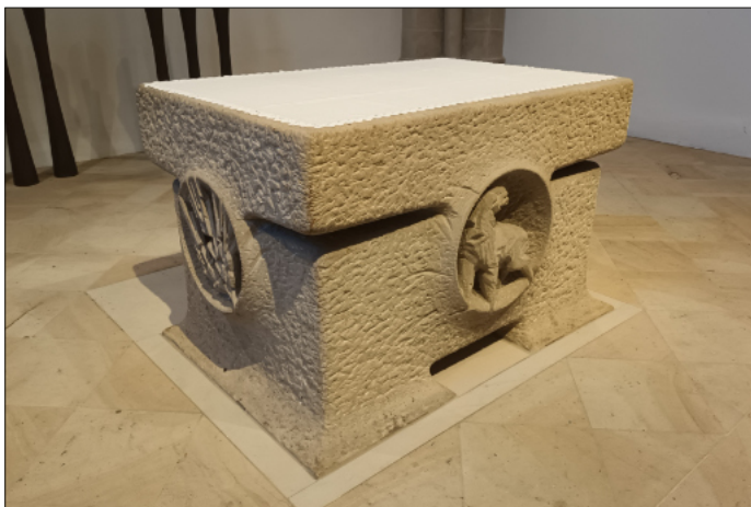
Altar in der Kirche St. Dionysius, Belm