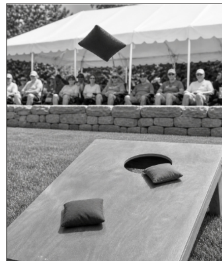
Wir lernen eine neue Sportart kennen: Cornhole – auf Bundesliga-Niveau!

Der Posaunenchor wird auch das Weinfest zu Beginn musikalisch unterstützen.