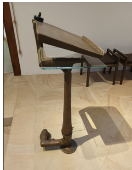
Ambo in der Kirche St. Dionysius, Belm