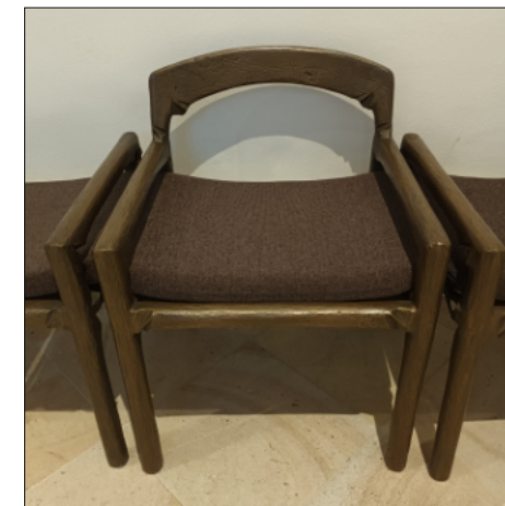
Sedilien in der Kirche St. Dionysius, Belm