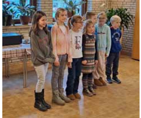
Immer wieder schön, der Besuch der Grundschul Kinder mit ihren Beiträgen