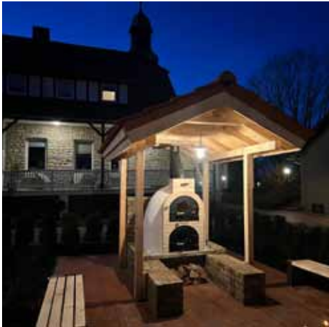
Teil des Projektes ist ein kleines Backhaus

im ländlichen Raum anknüpft. In Gemeinschaftsaktionen können nun Brote oder auch Pizza gebacken werden. Dafür hat sich ein Backhaus-Team gebildet, dem schon 20 Freiwillige angehören. Als weiterer Bestandteil des Gesamtvorhabens wird im kommenden Frühjahr die Neugestaltung des Geländes am offenen Pavillon nach ökologischen Gesichtspunkten abgeschlossen.