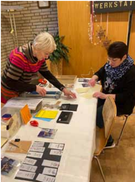
Im Pfarrheim konnten Besucher schöne Dinge basteln