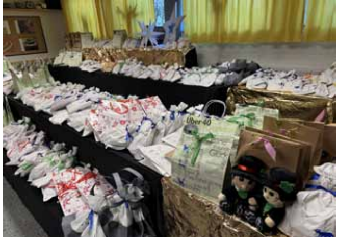
Was für ein Bild: Mehrere hundert Wundertüten warteten bei der Aktion „Du bist ein Gewinn – Jedes Los gewinnt“

Text: Holger Jansing