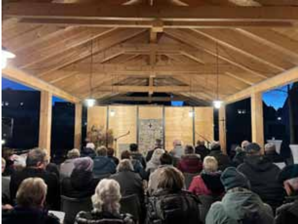
Gut bedacht: Der offene Pavillon ist sechs mal zwölf Meter groß und bietet zahlreichen Menschen bei Veranstaltungen unter freiem Himmel einen Schutz.

das Ergebnis sehen lassen könne. Wo Glaube, Liebe, Hoffnung und das Du im Mittelpunkt stünden, sei ein gutes Miteinander möglich. Die vier Begriffe sind auch Teil eines Mosaiks an der Rückwand des sechs mal zwölf Meter großen Pavillons.