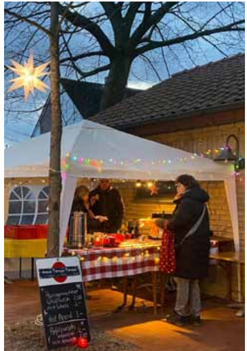
Fast 100 Liter Heißgetränke wurden bis zum späten Abend ausgetrenkt