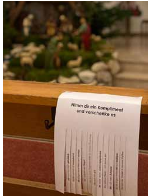
Komplimente zum Abpflücken in der Kirche