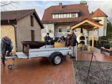
Aufbau mit vereinten Kräften. Zum Glück spielte passend das Wetter mit

finanzielle Gewinn kann sich sehen lassen. Inklusive einiger zweckgebundener Spenden kamen durch den Adventszauber gut 4.000 Euro zusammen. Die Hälfte davon steht für karitative Aufgaben in