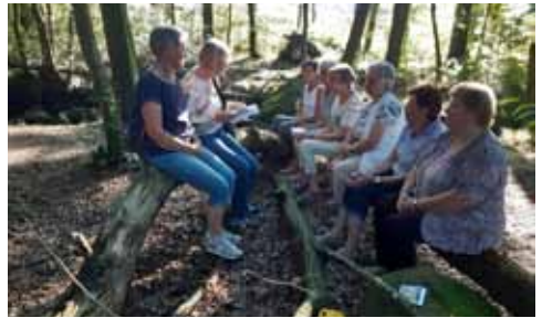
Unterwegs gab es herrliche Plätze für den Lobgesang Mariens und für unseren eigenen Lobgesang