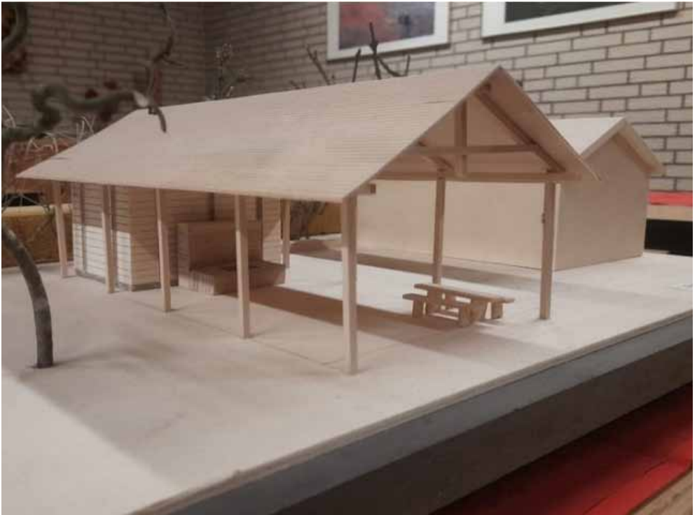
Modell-Entwurf Wolfgang Herich