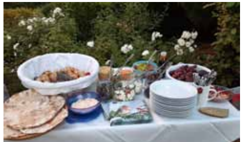
Bei einem reichhaltigen Mitbring-Bufett saßen wir noch bis spät in die Abendstunden bei der Taufperle rund um den Brunnen