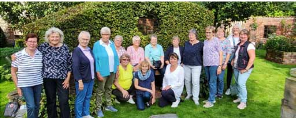
Ausflug der kfd-Mitarbeiter durch den Traumgarten von Familie Pötter

Text: Christa Kriegisch, Anne Escher Fotos: Katharina Bolte, Christa Kriegisch