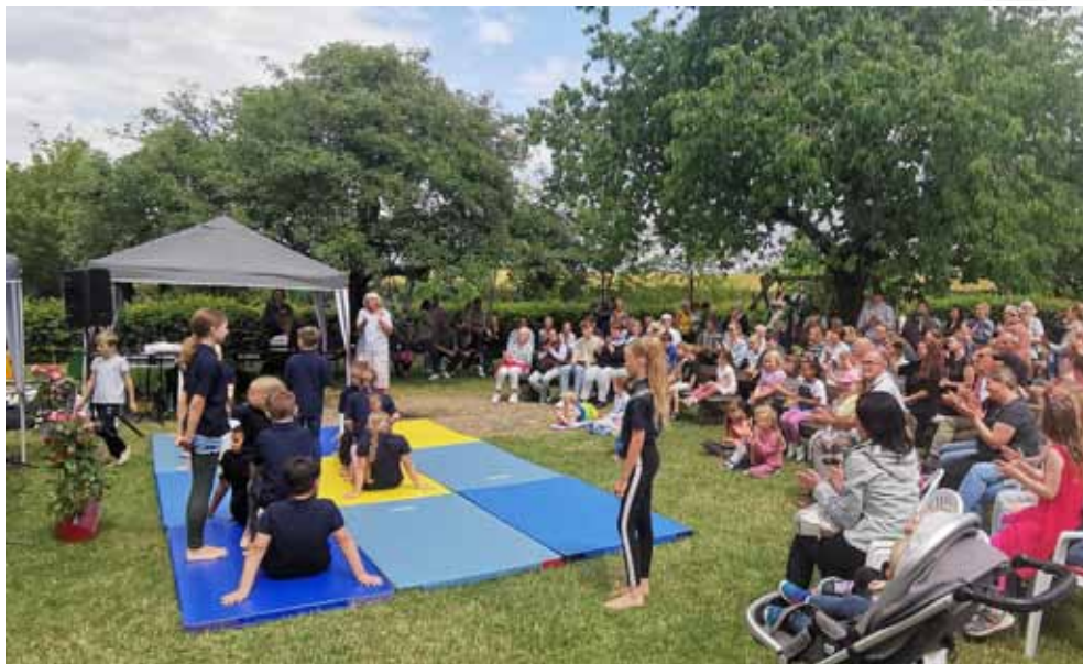
Um 14 Uhr wurde das Bühnenprogramm von der Grundschule Icker mit einem starken Programm eröffnet. Danach folgten verschiedene Musikgruppen.