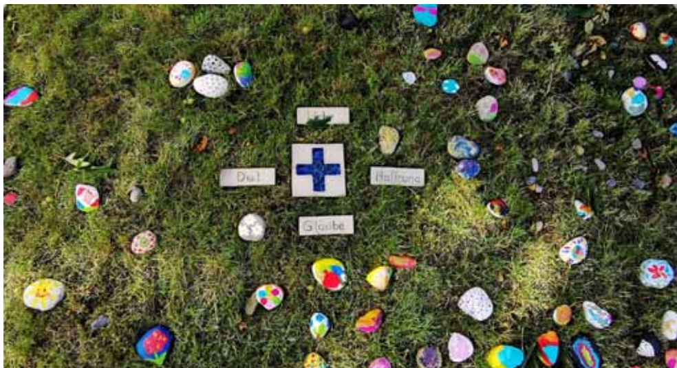
„Ihr seid die lebendigen Steine“. Sehr viele Feldsteine wurden von Jung und Alt bemalt und mit eigenem Namen versehen.