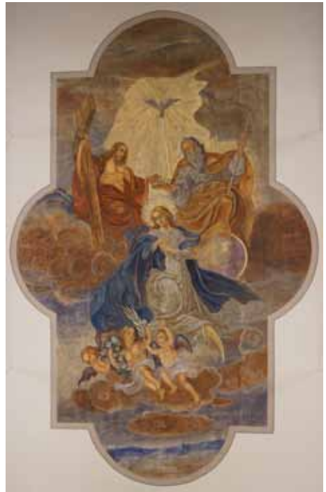
Das Deckengemälde der Kirche stellt die Himmelfahrt und Krönung Mariens dar