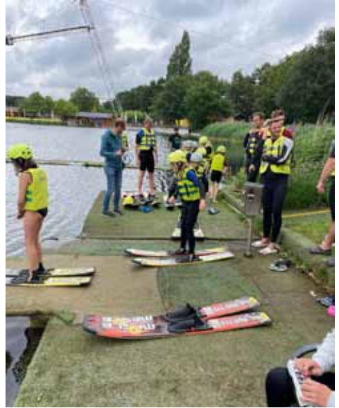
Viel Spaß hatte die Wasserskigruppe