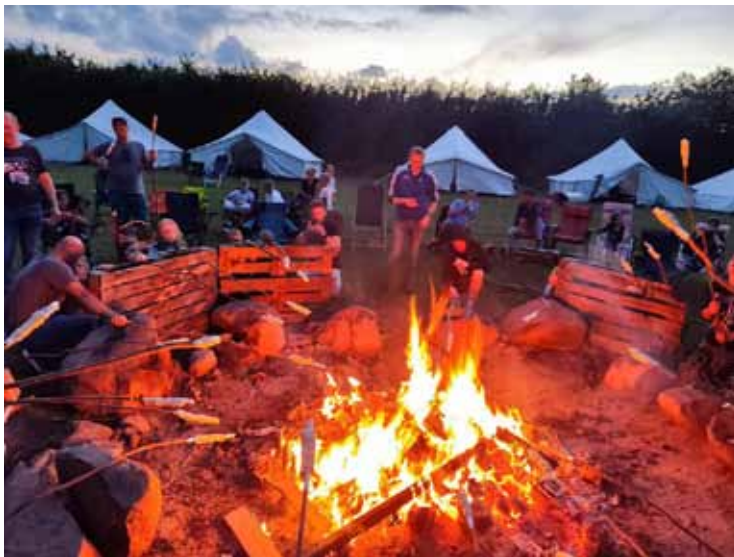
Mit einem Lagerfeuer und mit Stockbrotbacken wurde der Abend beendet.