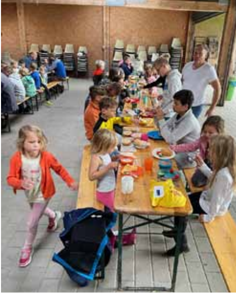
Ein reichhaltiges Frühstück sorgte für einen guten Start in den Tag