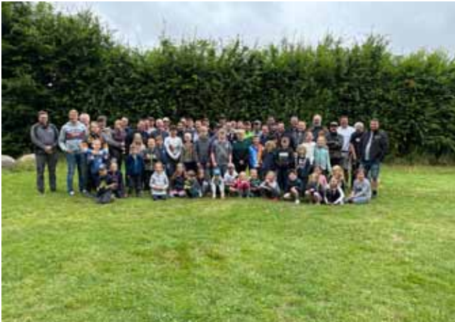
47 Kinder und 31 Erwachsene waren begeistert im Vater/Opa/Kind-Zeltlager.

Vom 8. bis 10. Juli haben 47 Kinder und 31 Erwachsene am Vater/Opa/Kind-Zeltlager teilgenommen. Leider konnten Corona bedingt 19 Teilnehmer nicht teilnehmen.