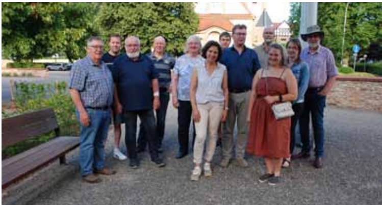
Vertreter von beiden Kirchenvorständen Belm und Icker auf dem Kirchplatz „Mittendrin“