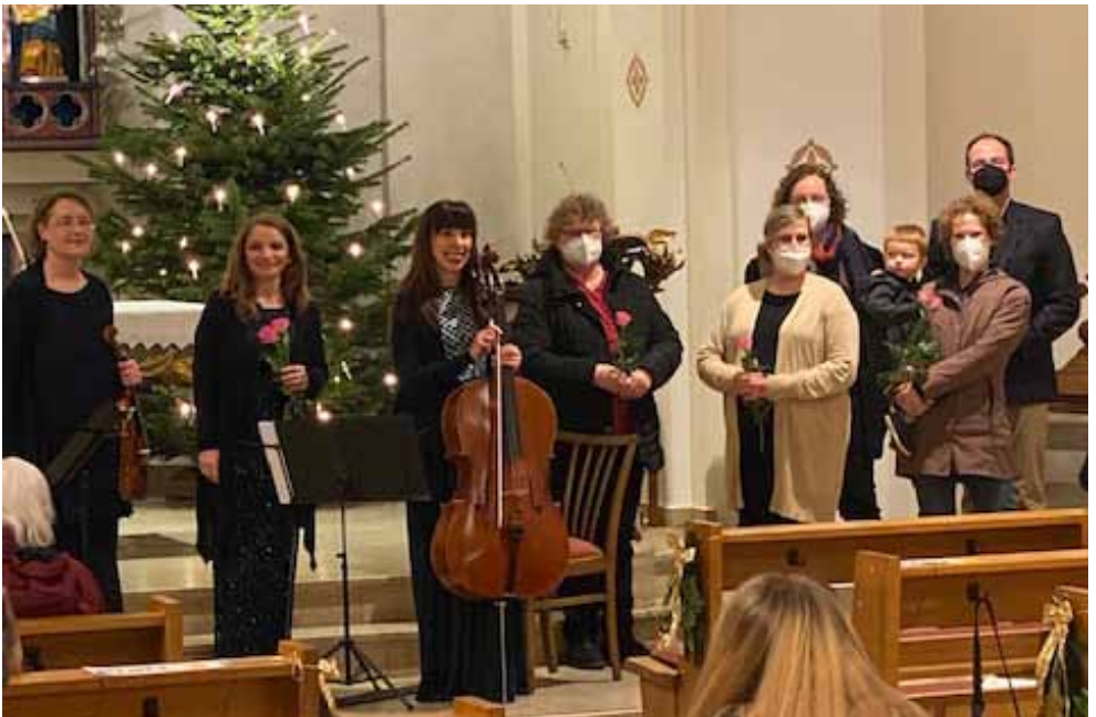
Winterkonzert von TriOsarte