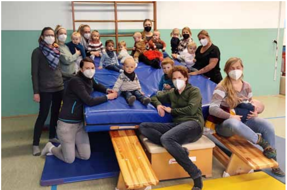
Die Krabbelgruppe trifft sich jeden Freitag in der Turnhalle Icker