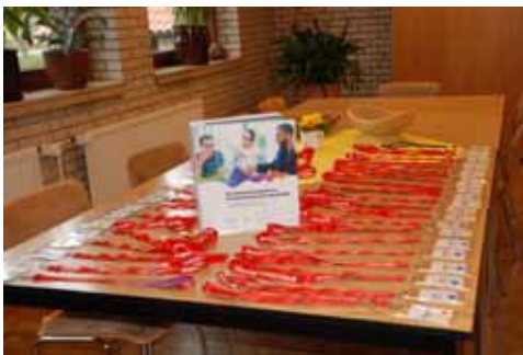
Namensschilder für den Deutschkurs in beiden Sprachen

Inzwischen gibt es mehrere Deutschkurse, Gesprächsabende für die gastgebenden Familien und Absprache-Termine zwischen denen, die den Deutschunterricht übernehmen.