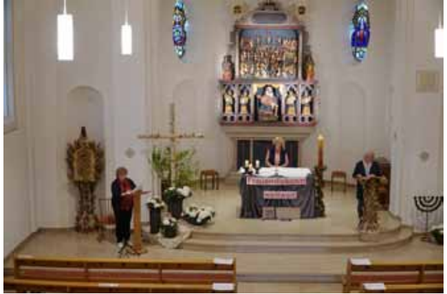
Regionalgottesdienst zum Tag der Diakonin.