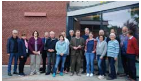
Treffen vom Kirchenvorstand Vehrte und Icker und dem Pfarrgemeinderat.