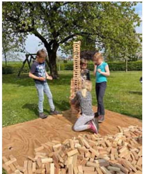
Text und Foto: Ansgar Biemann

Kommt gerne vorbei! Wir werden uns eine gute Zeit machen.