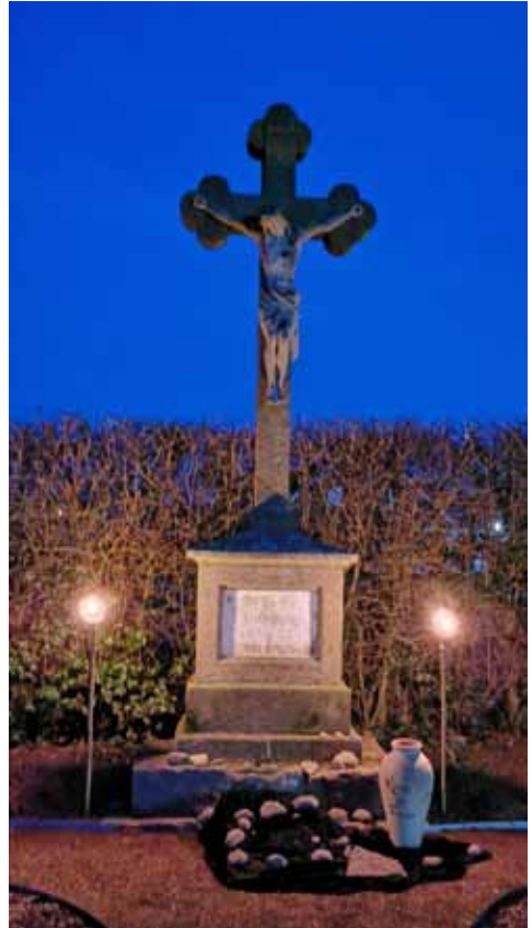
„Gekreuzte Wege 2021“