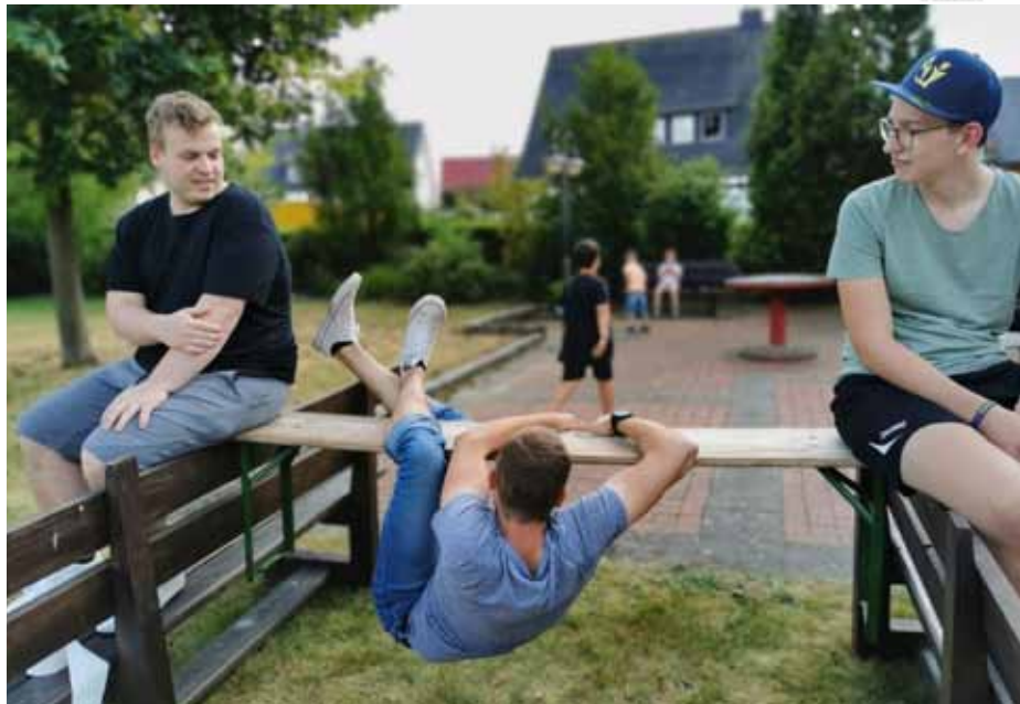
Alternatives Zeltlager - Rekordspiel