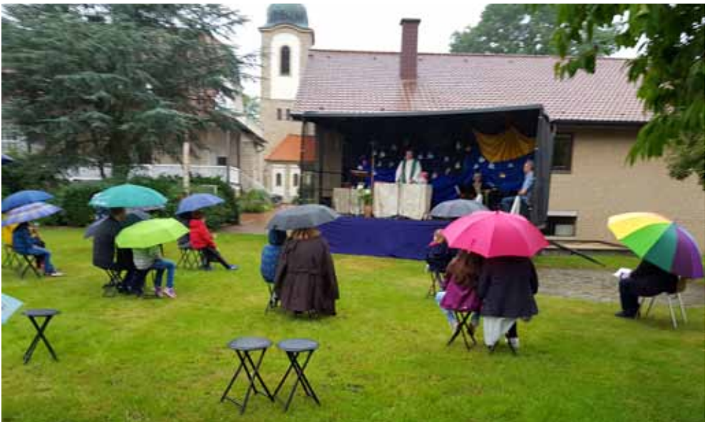
Picknickgottesdienst der Erstkommunionfamilien unterm Regenschirm