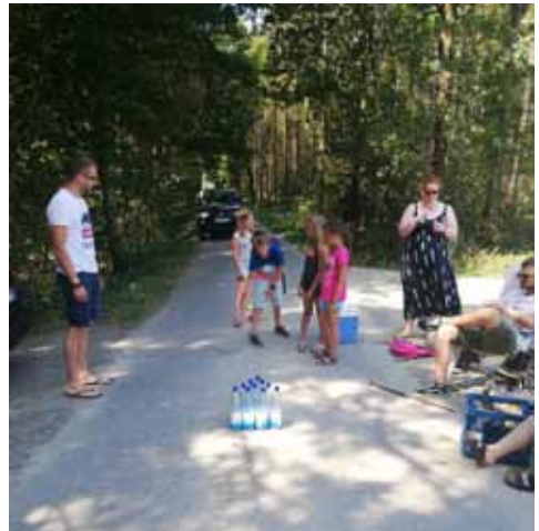
Alternatives Zeltlager - Stationslauf

worten und gleichzeitig Gruppenleiter suchen mussten. Auch das Schild am Pfarrheim, auf dem für unseren Bauchladen geworben wurde, sorgte für Interesse. Während der drei Wochen öffneten wir täglich für eine Stunde den Pfarrheimkeller, wo typische Zeltlager-Süßigkeiten und die Zeltlager-Armbänder für kleines Geld verkauft wurden. Hier gab es auch eine Menge Wassereis, welches bei den heißen Temperaturen natürlich heiß begehrt war.