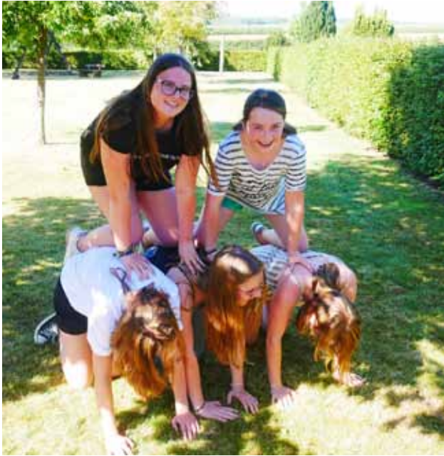
Alternatives Zeltlager - Pyramiden bauen