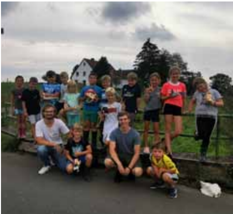
Alternatives Zeltlager - Floß bauen

weil die Kinder beim Stationslauf den ganzen Tag rund um Icker unterwegs waren, um verschiedene Aufgaben zu lösen. Ein weiterer Höhepunkt während unseres Programms war mit Sicherheit die Grusel-Nachtwanderung. Während des Zeltlagers bereiten diese normalerweise die ältesten Teilnehmer vor, aber dieses Jahr haben es sich die Gruppenleiter nicht nehmen lassen, selbst eine Nachtwanderung für die großen Teilnehmer vorzubereiten. So durften auch wir Gruppenleiter uns kurz wieder in unsere Teilnehmer-Zeit versetzen.