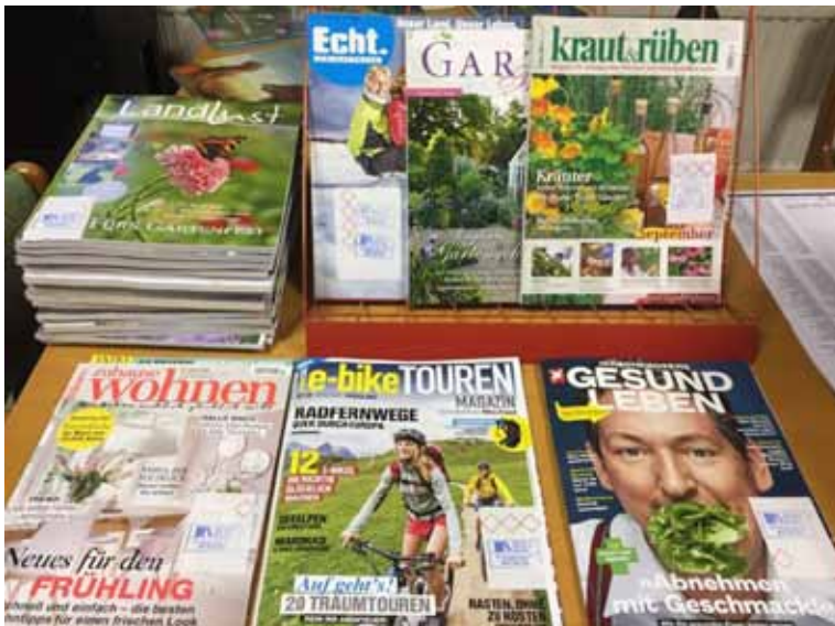
Neu bei uns in der Bücherei