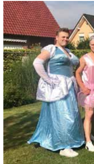
Alternatives Zeltlager - The Clock