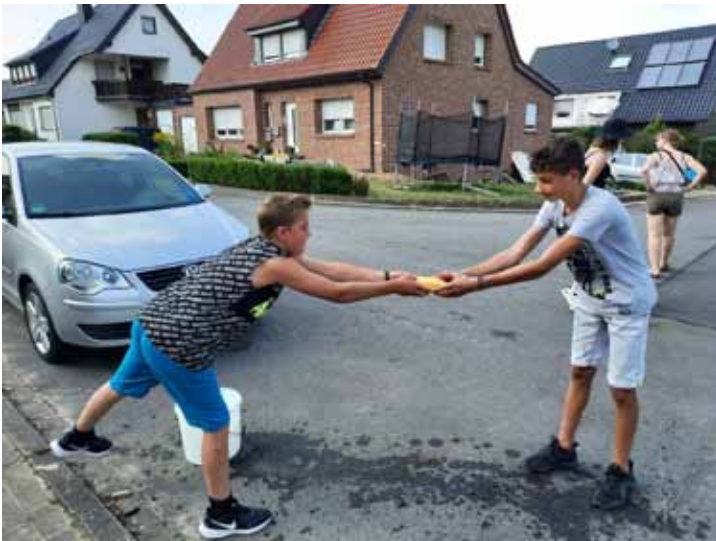
Alternatives Zeltlager - The Clock