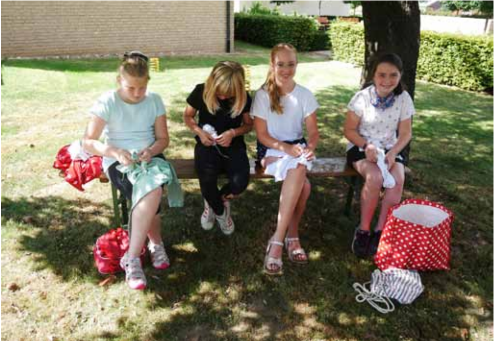
Alternatives Zeltlager - Batiken