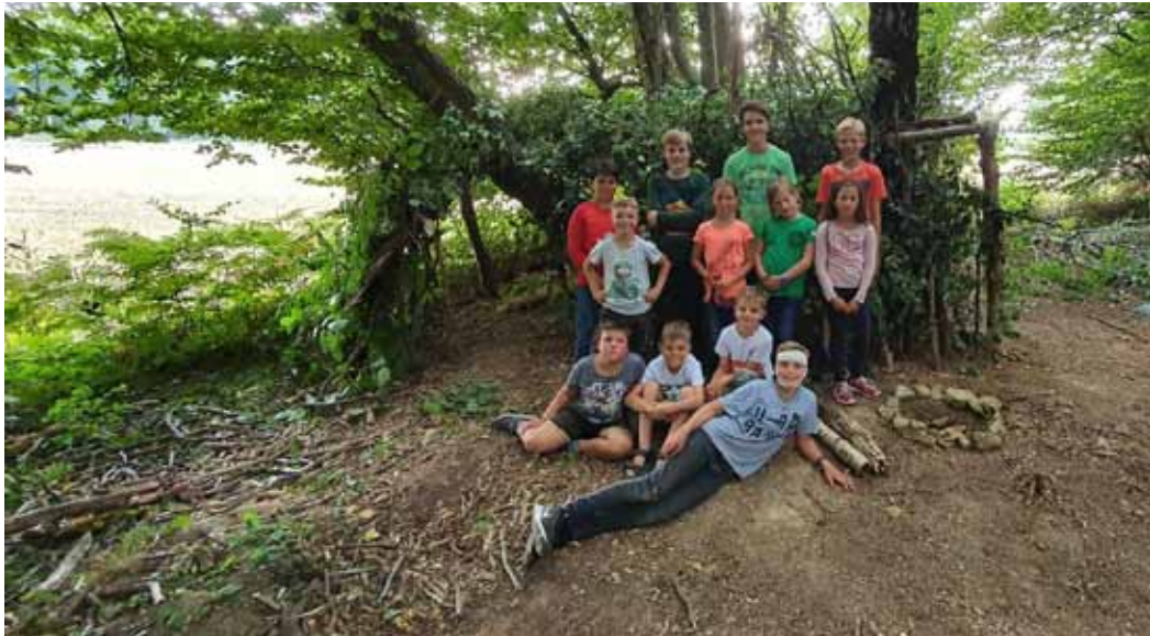
Alternatives Zeltlager - Bude bauen