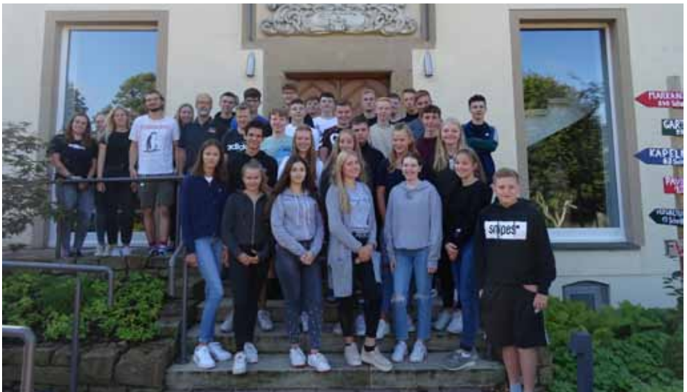
Start der Firmvorbereitung in der Jugendbildungsstätte Haus »Maria Frieden«