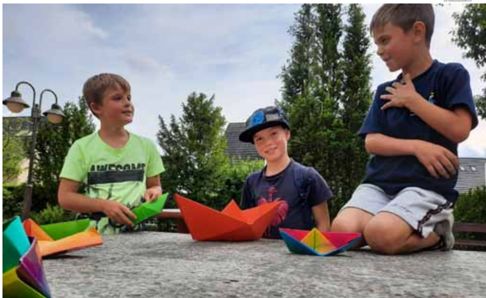
Alternatives Zeltlager - Papierschiffe bauen