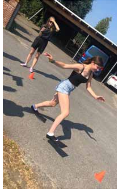
Alternatives Zeltlager - Pinguin