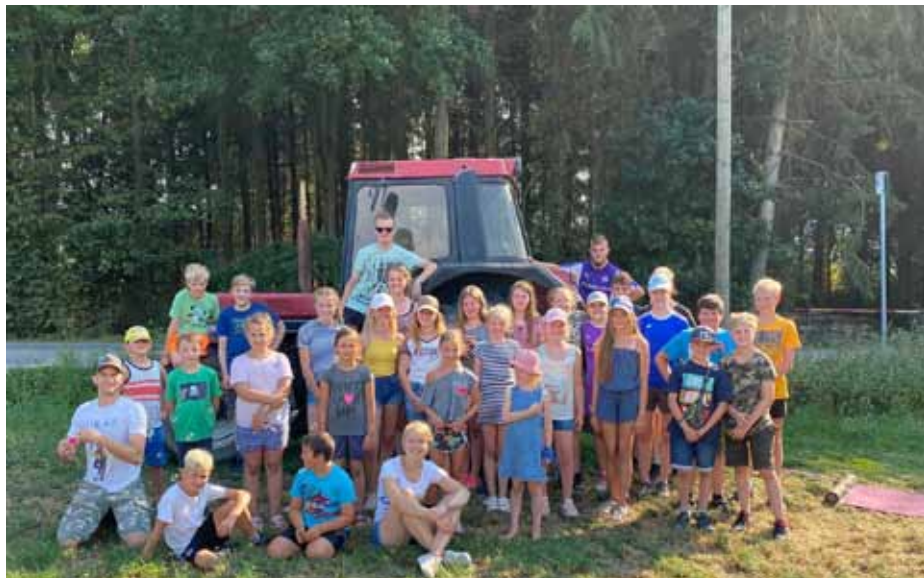
Alternatives Zeltlager - Schlitten fahren