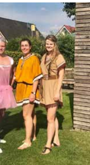
Zeltlager - Dorfspiel