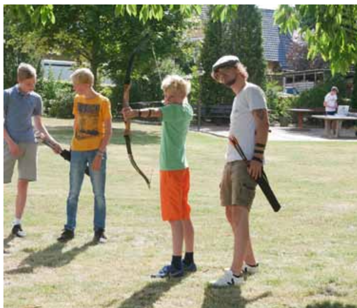
Alternatives Zeltlager - Bogenschießen