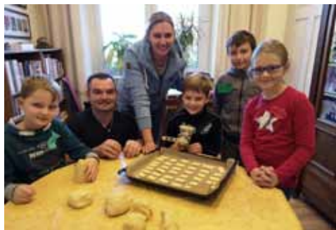
In der Weihnachtsbäckerei mit Eltern

Ganz fleißig und mit viel Freude haben die Kinder mit Elternvertretern, Großeltern und Katechetinnen Plätzchen für die Kranken und älteren Menschen in unserer Gemeinde gebacken. Fast 50 Tütchen konnte das Krankenbesuchsteam davon packen und beim Adventsbesuch in den Häusern abgeben – mit einem schriftlichen Gruß von den Kindern. Sicherlich war die Freude bei dieser Aktion auf beiden Seiten groß.