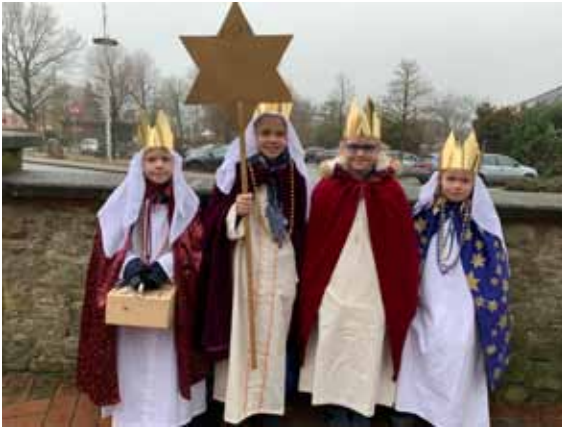
Die jüngste Sternsinger Gruppe – zum ersten Mal dabei!

Syrien und der Libanon sind in diesem Jahr auch Schwerpunktländer der Misereor-Fastenaktion. Beide Hilfswerke wollen so eine Region in den Mittelpunkt stellen, die von großer ethnischer, religiöser und kultureller Vielfalt, aber auch von zahlreichen Konflikten geprägt ist.