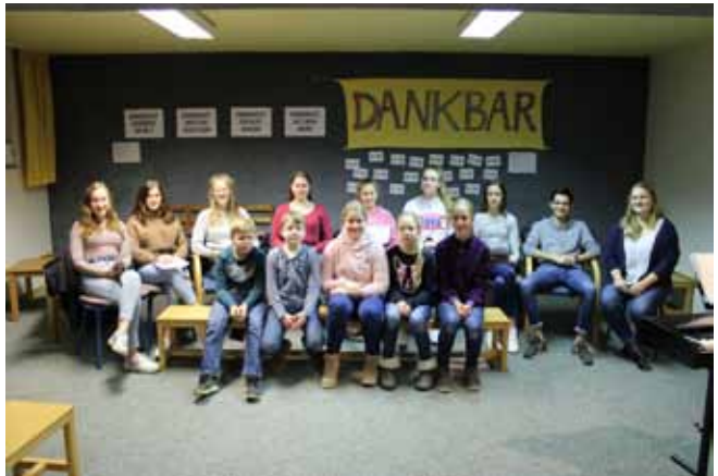
Chorprobe der Rhythmics für den Sternsinger Gottesdienst in der Herz-Jesu-Kirche