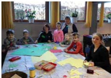
Beim Basteln und schreiben der Weihnachtsgrüße

Weiter geht es in der Vorbereitung mit folgenden Terminen: