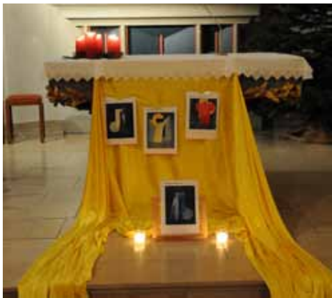
Abendlob vom 11. Januar 2017

Ich ging meinen Weg. Ein Mensch hörte mir zu und tröstete mich. Ich ging meinen Weg. Ein Wort gab mir Hoffnung und ließ mich weitergehen. Ich ging meinen Weg. Ein Freund machte mir Mut und unterstützte mich. Ich ging meinen Weg. Ein Erlebnis ließ mich aufhorchen und Neues probieren. Ich ging meinen Weg. Ein Kind schenkte mir Vertrauen und machte mich stark. Wir gehen unsere Wege und begegnen Engel, die Boten Gottes.