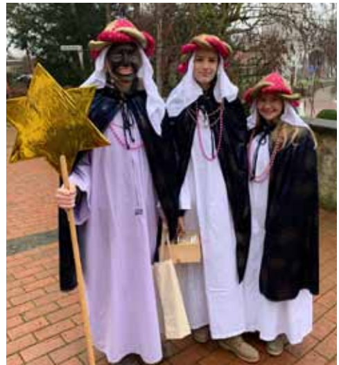
Jugendliche Sternsinger – seit mehreren Jahren dabei!

Immer mehr Erwachsene unterstützen die Aktion weil „Segen bringen-Segen sein“ Aufgabe aller Generationen ist.