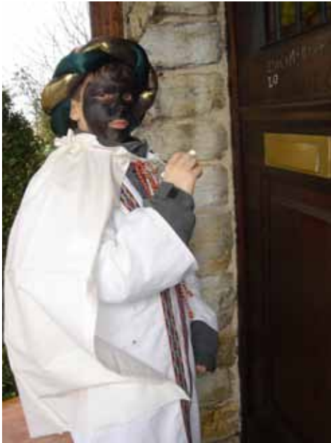
Seit Jahrzehnten schreiben Sternsinger den Segen an die Haustüren Archivfoto 2005

20 * C + M + B * 20 an die Türen und das mit großer Freude. Bereits im Vorfeld bereiten sich Kinder, Jugendliche und Erwachsene auf diese Aktion vor, die in diesem Jahr unter dem Motto steht: „FRIEDEN! Im Libanon und weltweit.“