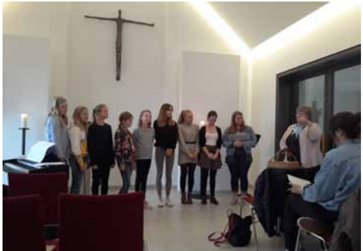
„Ein Stern für Dich“ als Dankeschön für alle Solisten des 14. Liederabends

und dennoch getröstet Abschied nehmen können oder bei den unterschiedlichsten Veranstaltungen in der Kapelle Trost und Hoffnung finden, wie bei dem 14. Liederabend an dem Solistinnen der Rhythmics sangen und wir manches neue Got-