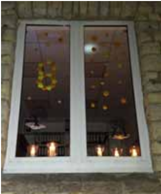
Adventsfenster am Pfarrbüro