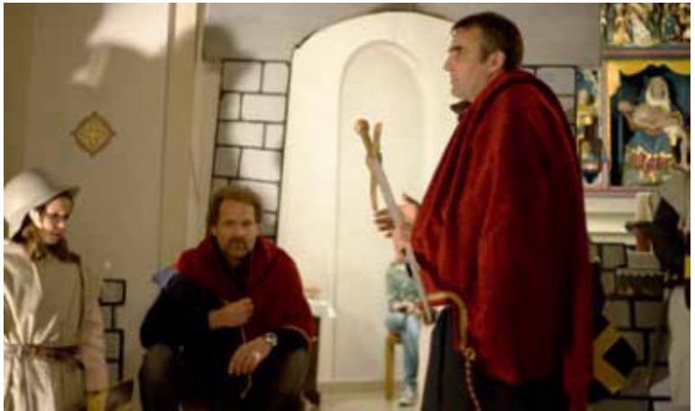
St. Martin und der Bettler - Szene aus dem letzten Jahr