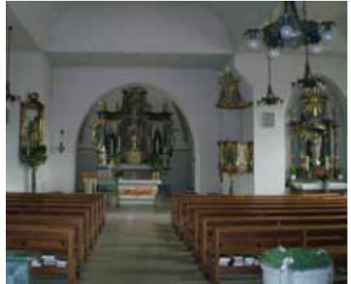
Barock-Altar in der Pfarrkirche Remsede

Abfahrt: 13:15 Uhr ab Bahnhof Vehrte 13:30 Uhr ab Kirche Icker