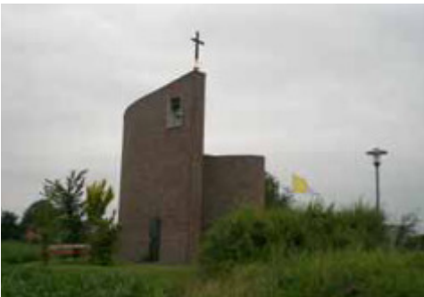
Die neue Wegkapelle in Bad Laer- Müschchen