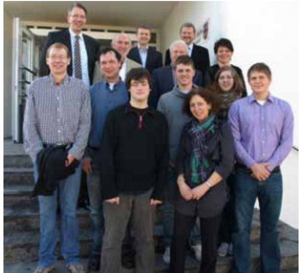
Die Vertreter des Bolzplatzteams vor dem Rathaus

Das Bolzplatzteam Icker wurde dieses Jahr zum wiederholten Mal von Bürgermeister Wellmann zum Neujahrsempfang der Gemeinde Belm ins Rathaus eingeladen. Der Bürgermeister lobte das ehrenamtliche Engagement der Ickeraner, die nicht nur mit viel