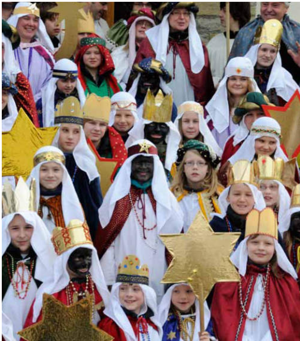
Die Sternsinger zeigen Stärke