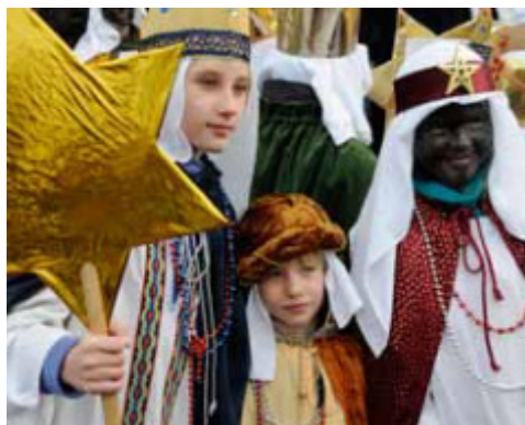
Eine von vierundzwanzig Sternsingergruppen