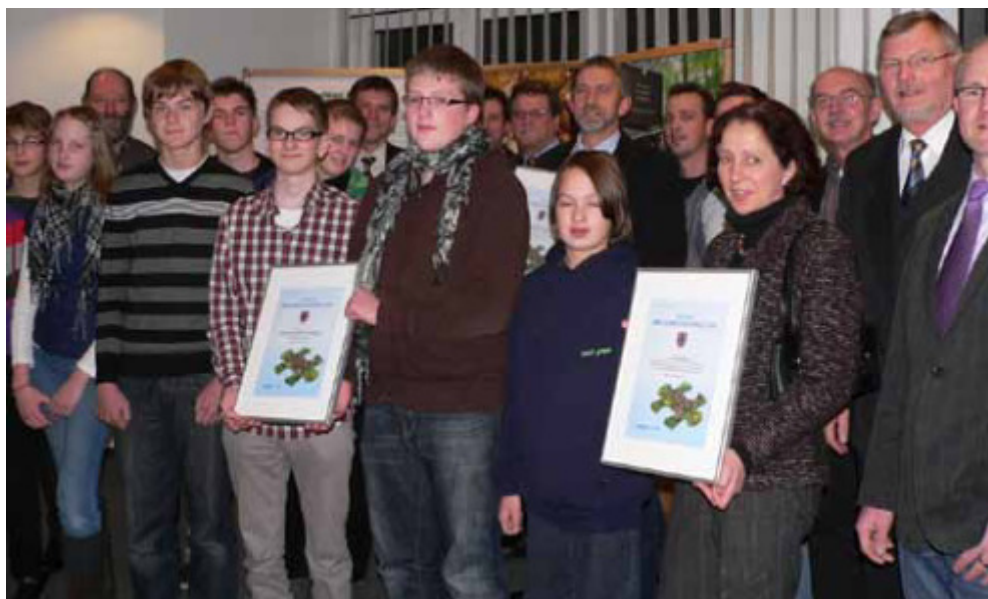
Übergabe des Klimaschutzpreises im Rathaus Belm