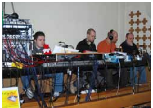
Verantwortlich für Licht und Ton Das Mum(m)-Technik-Team