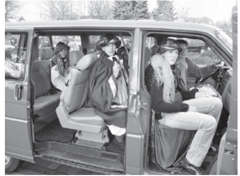
Sternsinger on Tour

Eine von 24 Sternsingergruppen Es ist einfach Klasse, wie sich Kinder, Jugendliche und Erwachsene immer wieder zusammentun, um dieses wirklich tolle Projekt durchzuführen. Allen, die dabei waren, herzlichen Dank.