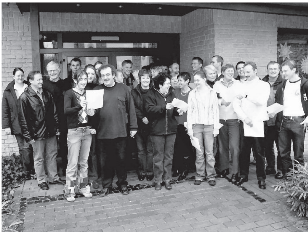
Die Ideenschmiede des neuen Musicals