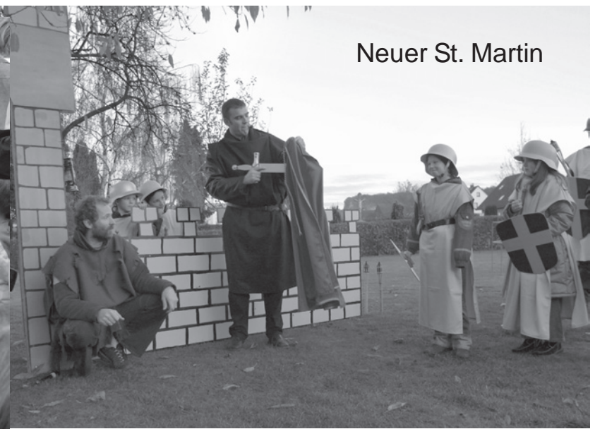
Neuer St. Martin