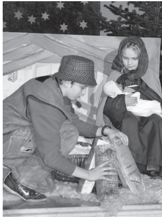
Krippenspiel der Kinder