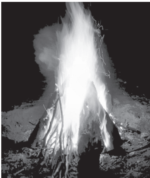
Wie ein kleines Osterfeuer: Das Zeltlagerfeuer 2003 in Schwegen

Auch in diesem Jahr lädt die Jugend Icker am Ostersonntag (27. März) ab 20 Uhr wieder zum alljährlichen Osterfeuer ein. Es wird wieder oben auf dem Berg, an der Kreuzung „Power Weg“ / „Icker Kirchweg“ stattfinden. Für das leibliche Wohl ist mit Getränken, Bratwürsten und Steaks gesorgt. Wir, die Jugend Icker, würden uns freuen, Sie am Ostersonntag begrüßen zu dürfen. Eine Bitte hätten wir noch: Beim Osterfeuer dürfen nur Grünabfälle und kein behandeltes Holz verbrannt werden. Bretter, Dachlatten, Spanplatten u.ä. haben auf dem Osterfeuer nichts zu suchen, da die Verbrennung derartiger Materialien umweltgefährdend ist.